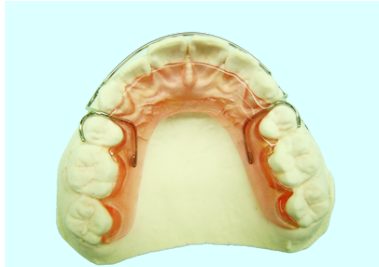
ホーレータイプリテーナー