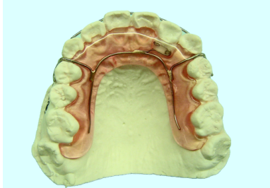
ホーレータイプリテーナー (弾線つき)