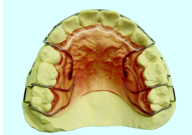
ホーレータイプリテーナー (アダムクラスプ使用)