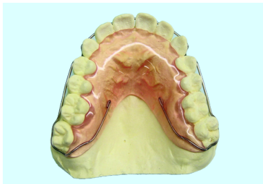
ベッグタイプリテーナー