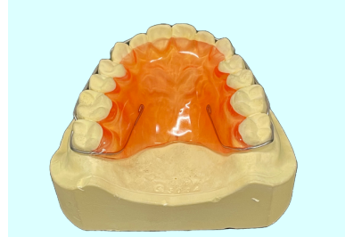
サーカムタイプリテーナー (ベッグタイプsolderd C Clasps)