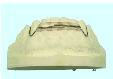
スプリングリテーナー