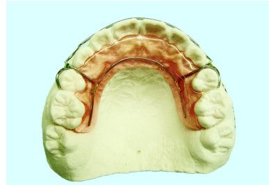
ホーレータイプリテーナー (補強線つき)