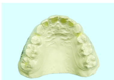
クリアリテーナー