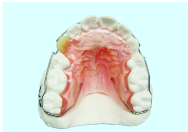
ベッグタイプリテーナー (人工歯つき)