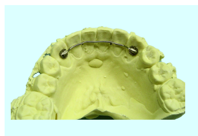
リングアルリテーナー